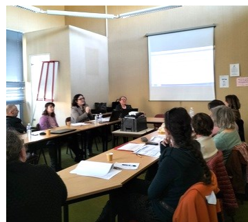
Réunion du 7 novembre 2024 Castelnaudary

La première d'une série de 5 réunions a eu lieu à Castelnaudary le 7 novembre dernier et a rencontré une fois de plus un franc succès !