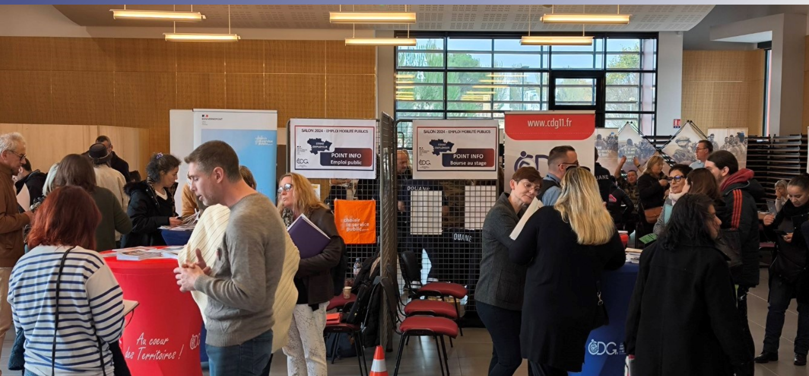
Salon du 19 novembre 2024 - Carcassonne