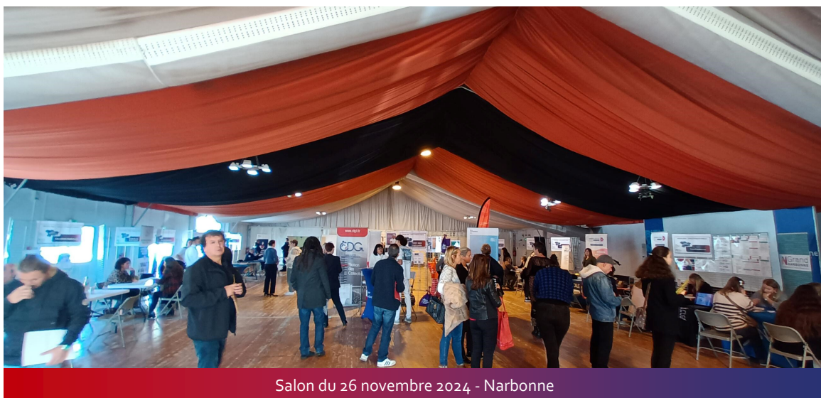
Salon du 26 novembre 2024 - Narbonne