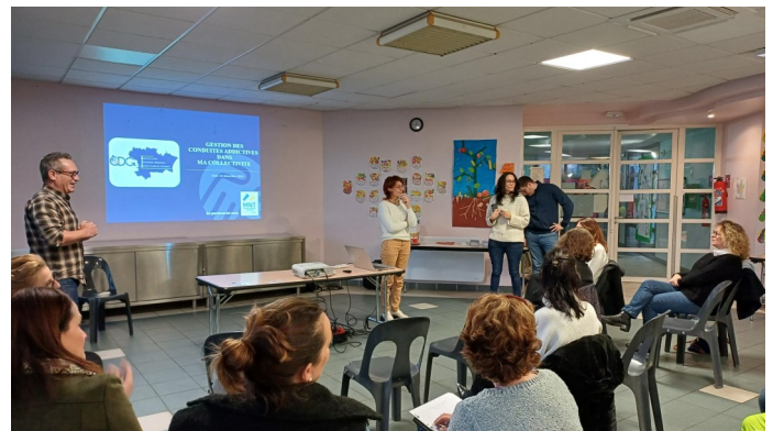
Rencontre du 10 décembre 2024 - Locaux Carcassonne agglo

Pour plus d'informations, vous pouvez prendre contact avec le service : prevention.santé@cdg11.fr